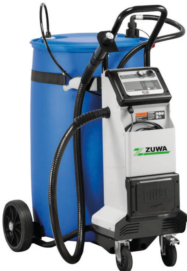
Delphin PRO mit 200 Liter Fass*

Dieselfahrzeuge mit SCR-Anlagen benötigen ein regelmäßiges Auftanken mit AdBlue®. Um diesem Bedürfnis gerecht zu werden, benötigen moderne Werkstätten eine schnelle, zuverlässige und saubere Lösung.